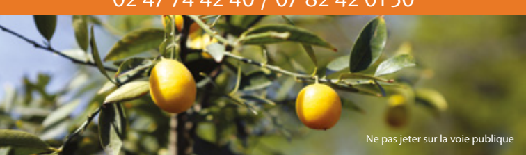
Ne pas jeter sur la voie publique